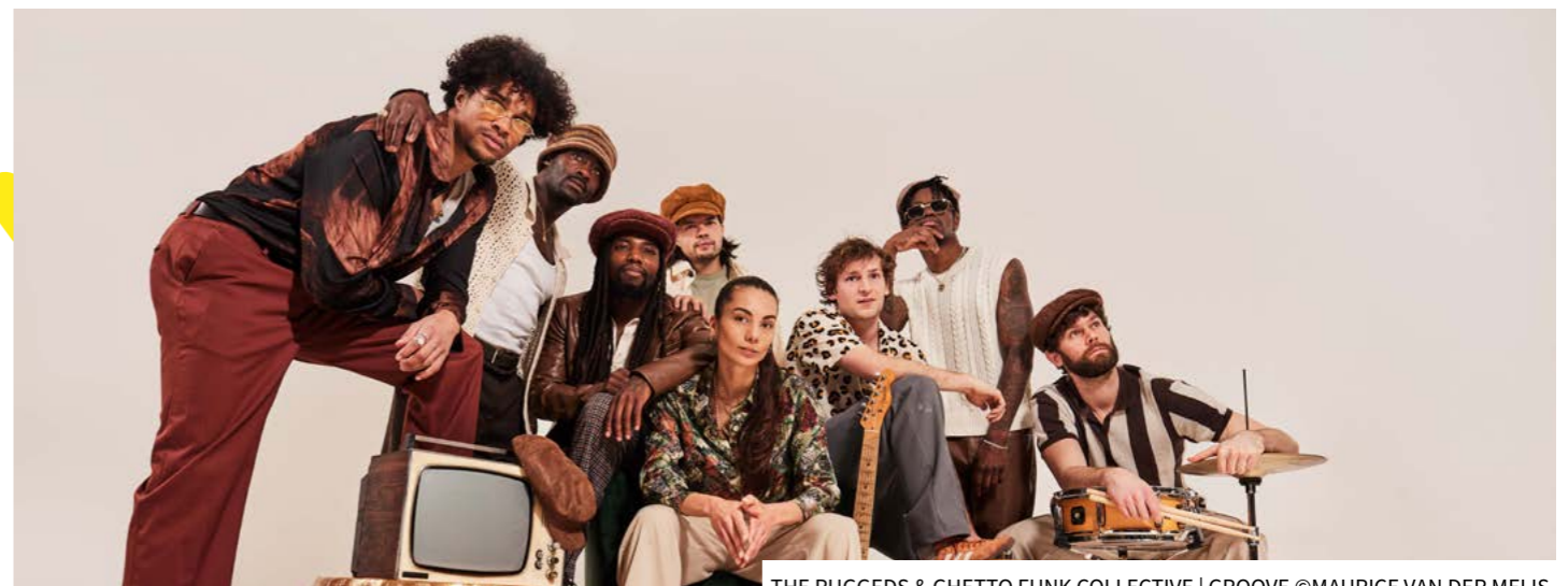
THE RUGGEDS & GHETTO FUNK COLLECTIVE | GROOVE