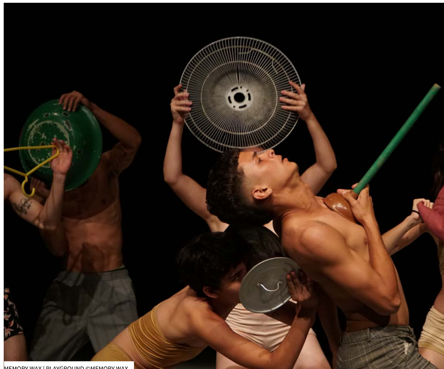
MEMORY WAX | PLAYGROUND