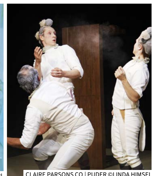
CLAIRE PARSONS CO. | PUDER