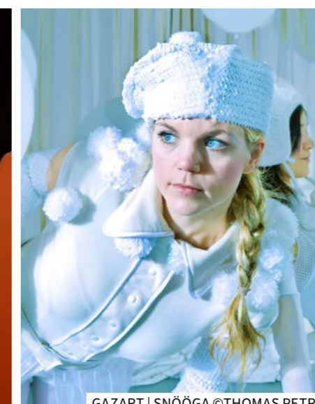
GAZART | SNÖÖGA