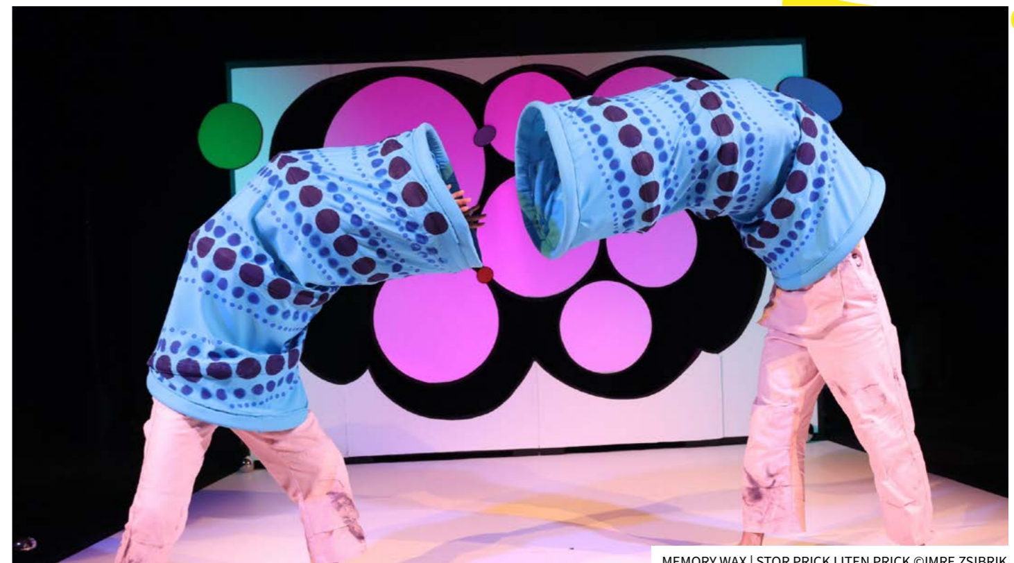
MEMORY WAX | STOR PRICK LITEN PRICK

2022: 229 arr 15.465 besök och 15.075 besökare vid 224 olika tillfällen.