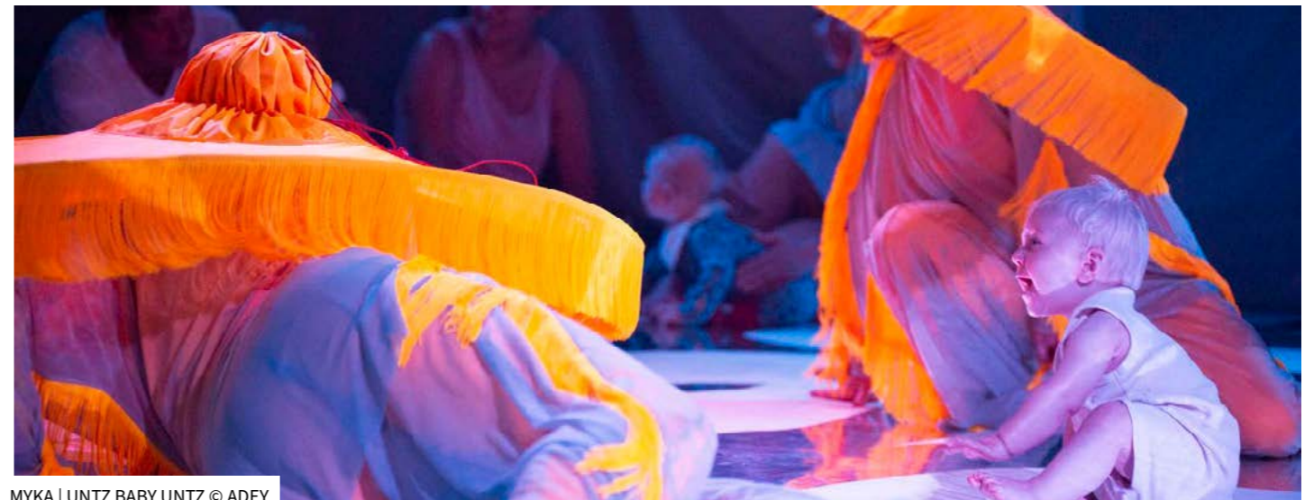
MYKA | UNTZ BABY UNTZ © ADEY